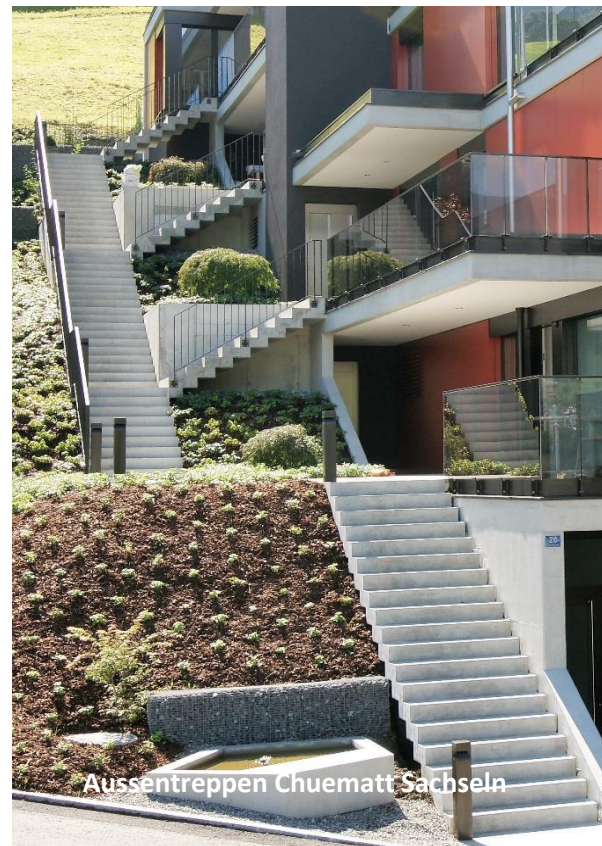
Ausstertreppen Chuematt Sachseln

Die Verwendung von vorfabrizierten Treppen bietet der Bauherrschaft nebst der hohen Passgenauigkeit eine wirtschaftlich interessante Alternative. Die Treppen sind nach der Montage sofort begehbar.