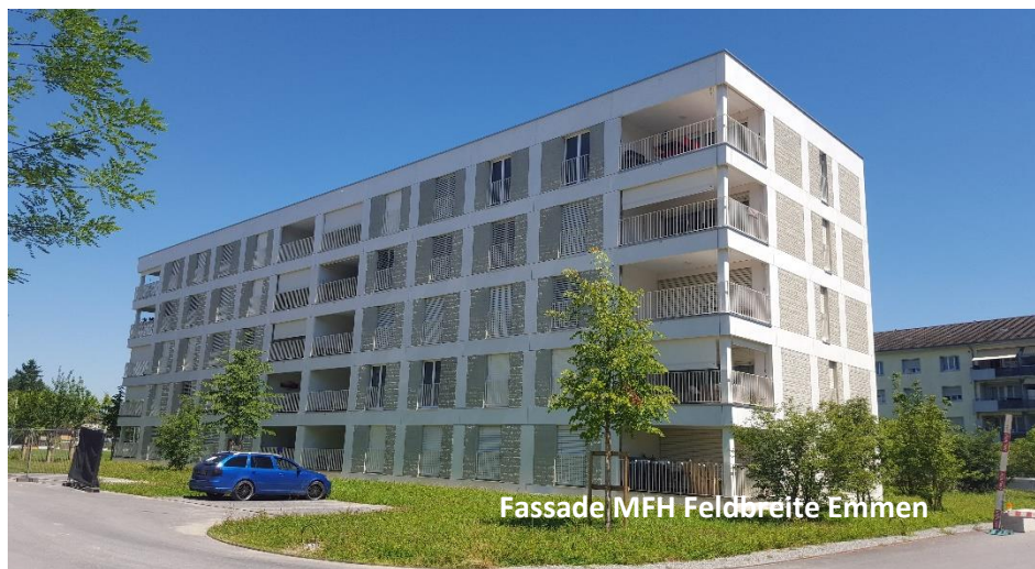
Fassade MFH Feldbreite Emmen

Vorfabrikate. Aus Beton. Aus der Schweiz. Die richtige Wahl. Dafür stehen wir ein.