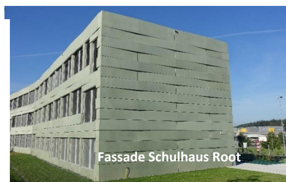
Fassade Schulhaus Root

Die Herstellung von Fassadenelementen erfolgt individuell nach Mass und auf Kundenwunsch. Mit Betonen aus Weisszement oder Farbbeton sind den kreativen Ideen der Architekten und Planer kaum Grenzen gesetzt. Auf Kundenwunsch können Strukturmatrizen eingesetzt oder Oberflächenbehandlungen wie z.B. Stocken oder Sandstrahlen vorgesehen werden. Die jahrzehntelange Erfahrung ermöglicht es uns, Fassaden verschiedenster Art als vorgefertigte Elemente herzustellen und zu montieren.