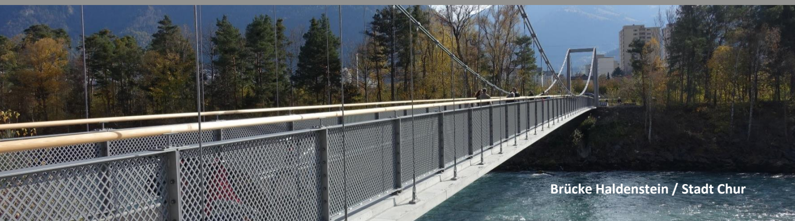
Brücke Haldenstein / Stadt Chur