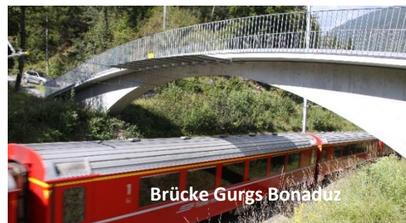
Brücke Gurgs Bonaduz

Die Herstellung von Brückenelementen erfolgt individuell nach Mass und auf Kundenwunsch. Die Grösse der Elemente richtet sich nach der Bauart, den örtlichen Gegebenheiten und den Transportvorgaben. Wichtig ist, dass bereits in der Planungsphase Wert auf diese Rahmenbedingungen gelegt wird.